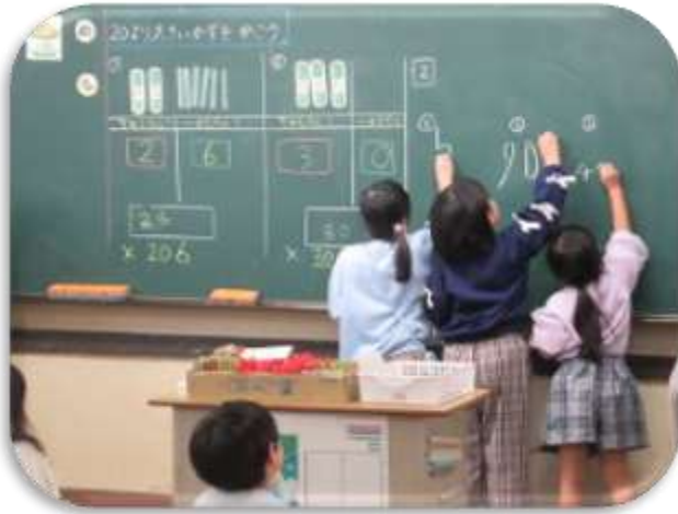
1年生算数黒板発表