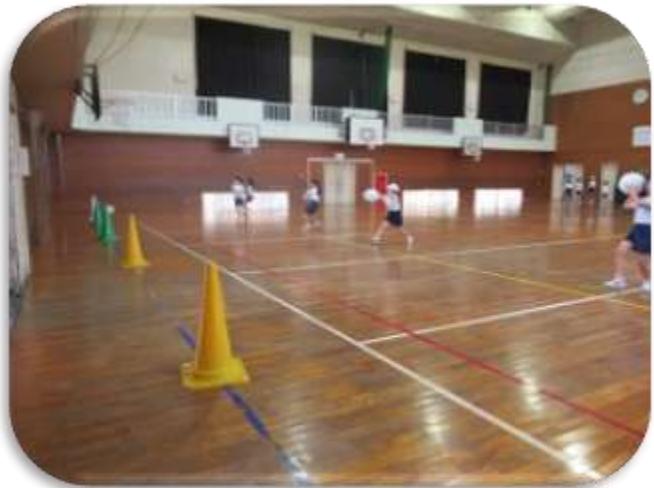
2年生の投げる運動遊び！