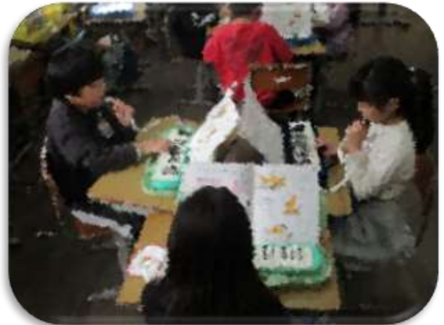
2年生音楽の協働学習