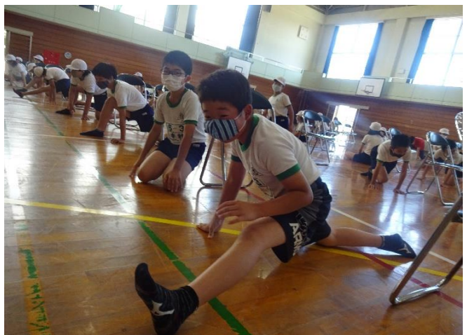
練習のおかげで体が柔らかくなったかな？