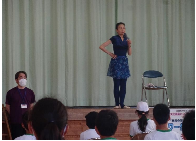
バレエの基本を教えてくださいました。