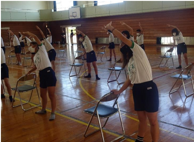
マスク着用で友達と距離をとって活動しました。