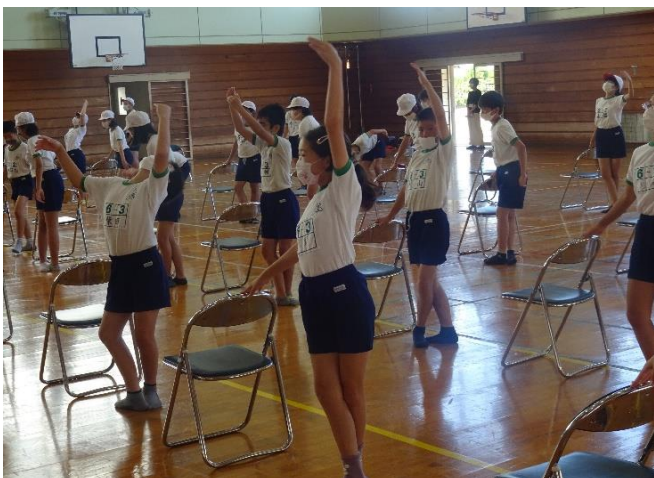
指先まで意識して美しい姿勢を練習しました。