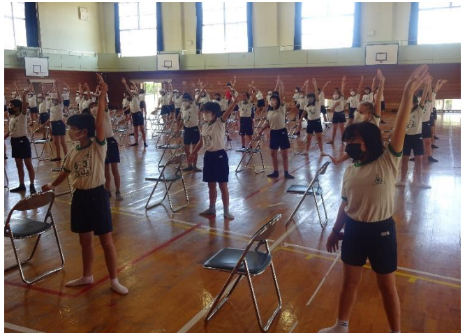
バレエ団のみなさんに合わせて動きを練習しました。