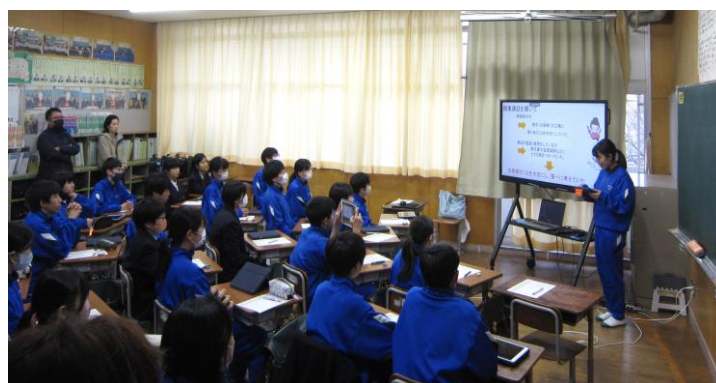
1年生「私の将来の生き方」発表風景