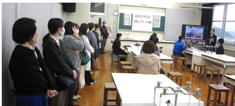
2年生「高校調べ」発表風景

2年生は、高校の特色について調べたことを発表しました。各生徒が、1つの学校を受け持ち、その学校の規模や学科、部活動の実績、進学状況など、様々な視点から調査し、発表を行いました。はきはきとわかりやすい発表を行うことに加え、聞く人の好奇心をくすぐったり、「なるほど」と思わせたりする発表があり、プレゼンテーションの大切さを生徒たち自身が理解する発表会になっていました。